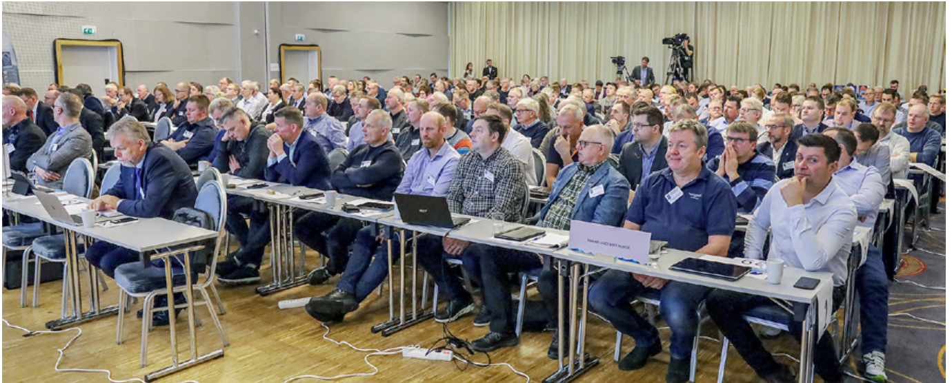
Ingen ting er skrevet i stein. Det gjelder også strukturordninger og kvotetak. Hva landsmøtet i Norges Fiskarlag til enhver tid måtte mene om dette vil selvfølgelig påvirke fiskeripolitikken og de valgene fiskeriministeren tar.

takene skal ligge fast. Vedtaket setter bare en tilsynelatende stopper for økt konsentrasjon av kvoterettigheter. Dette har ikke næringsaktørene protestert mot fordi det fortsatt er høyt under kvotetakene i de fleste fartøygruppene.